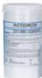
51012 Actidrox barattolo 1 kg.

Certificato CE n. 066 QPZ 300 Org. Not. n. 0373 Ist. Sup. di Sanità