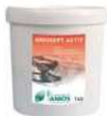
51014 Aniosept Activ barattolo 1 kg.

Polvere (bianca fine) 2 in 1 per la detersione e disinfezione + disinfezione di alto livello/sterilizzazione a freddo. Ampio spettro antimicrobico (sporicida al 2%). Formulato senza perborato e controllo della diluizione tramite striscetta. Leggermente profumata con stabilità del bagno di immersione di 24 ore.